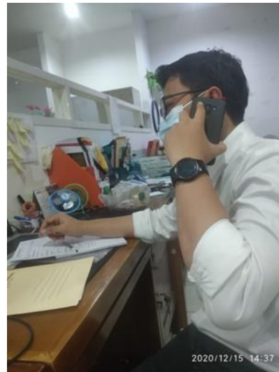
PT Abadi Primagas