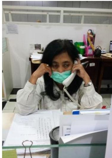
PT Penyebar Semangat

Jumlah Perusahaan yang Diberikan Asistensi Online Sebanyak 3 Perusahaan