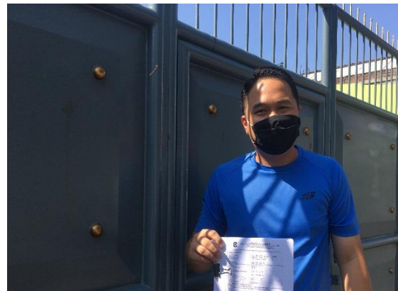
CV Berkat Candela Abadi Jl. Karang Asem 12/6