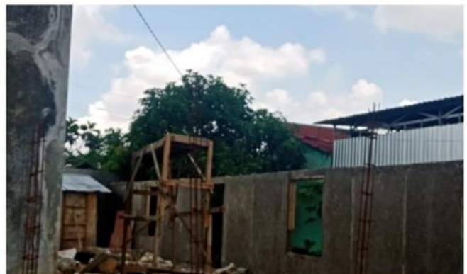
Jl. Keputih Timur Jaya VII No. 1