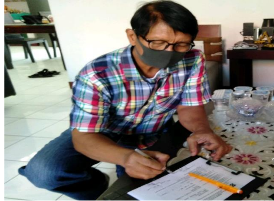
Poedingkoe Jl. Ikan Dorang Baru 1 No. 16