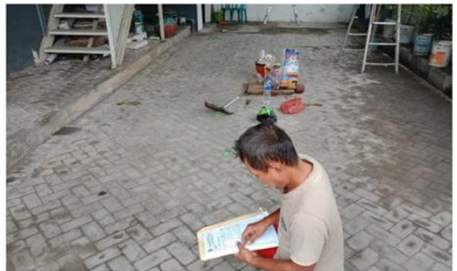
Jl. Keputih Permai No 47 Blok A 9