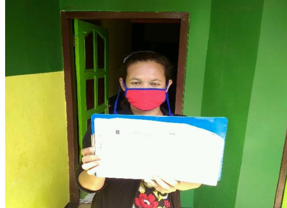
UKM Sambel Pecel Ndeso Jl. Mulyo Mukti No. 73 RT 02 RW 02