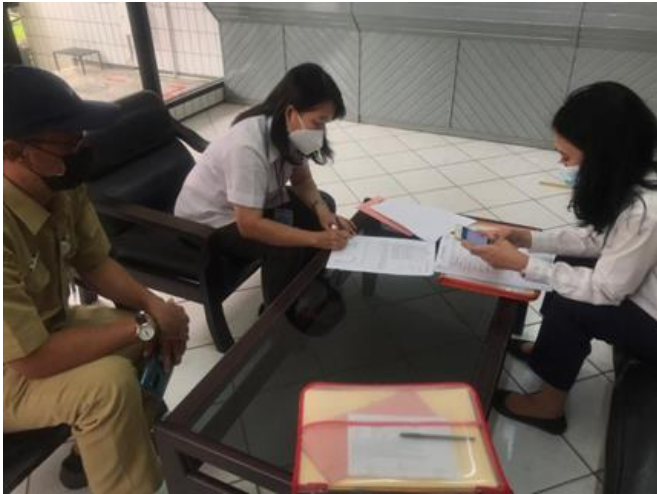
PT Platinum Ceramics Industry (PMDN) Jl. Karang Pilang Barat No. 201