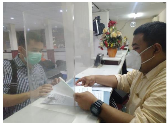
Pelayanan Loker Dinas Kesehatan

Jumlah Permohonan Perizinan Yang Masuk Sebanyak 114 Berkas