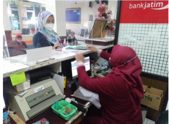
Pelayanan Loker Bank Jatim