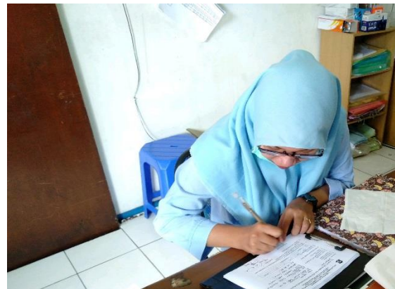
Jaya Usaha Jl. Kemayoran Baru No. 47 - 49