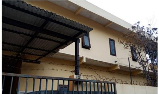
Jl. Keputih Permai Blok H1