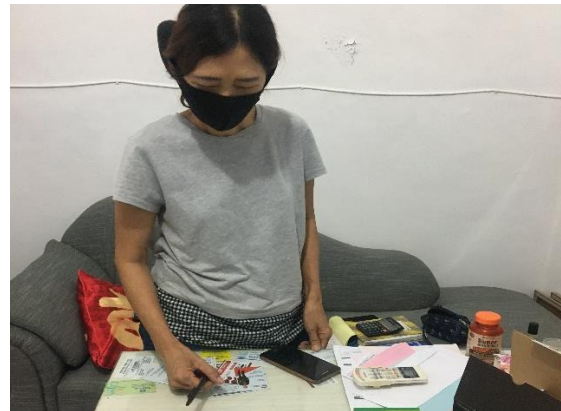
UD Jaya Sentosa Jl. Karang Asem 4/45