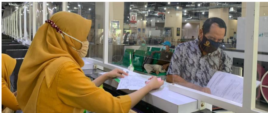
Pelayanan Loker Customer Services

Jumlah Permohonan Perizinan Yang Masuk Sebanyak 88 Berkas