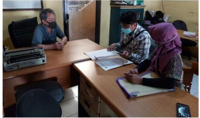
CV PANG PUTRA MANDIRI Jl. Raya Tambak Osowilangun No. 61 Blok C1