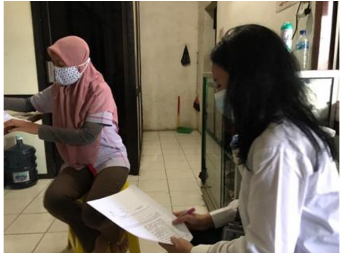
CV Gemini Mas Plastik (PMDN) Jl. Karang Pilang Barat No. 81