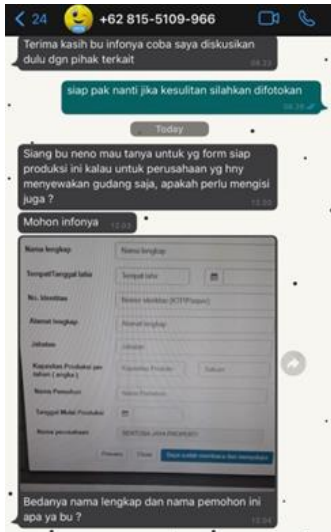
PT Sentosa Jaya Properti