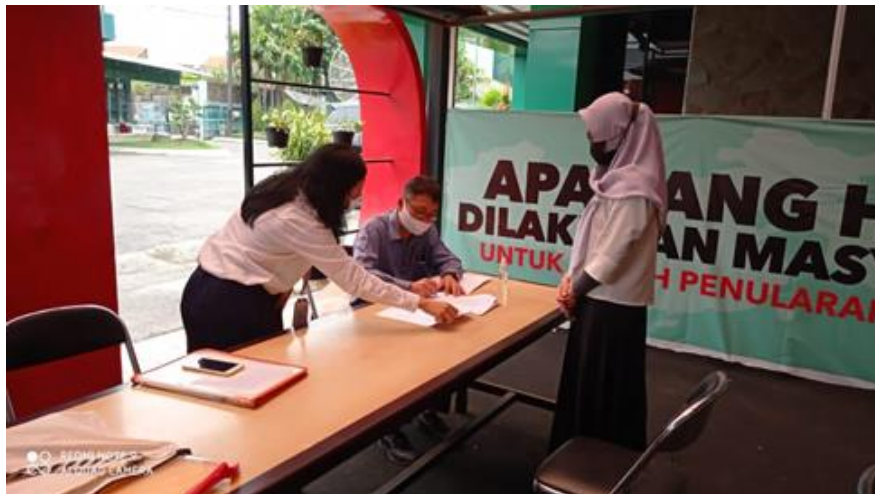
PT Henson Farma (PMDN) Jl. Karang Pilang Barat No. 200

Jumlah Perusahaan yang Diberikan Pengawasan/Survey Sebanyak 3 Perusahaan