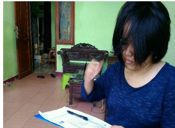
Kamilah Homemade Pondok Benowo Indah Blok FN - 6 RT 04 RW 10