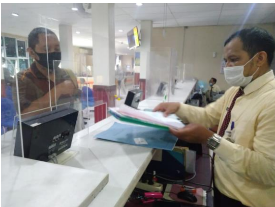
Pelayanan Loker Customer Service